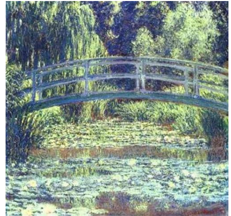
Ponte Japonesa , do artista Claude Monet.